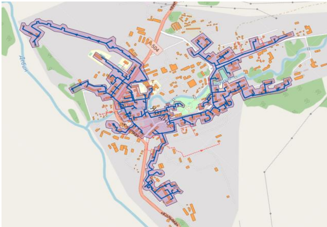
Рис. 2.1. Зоны деятельности ЕТО ООО «Теплоэнергия» «Ягодинский» посёлка Ягодное