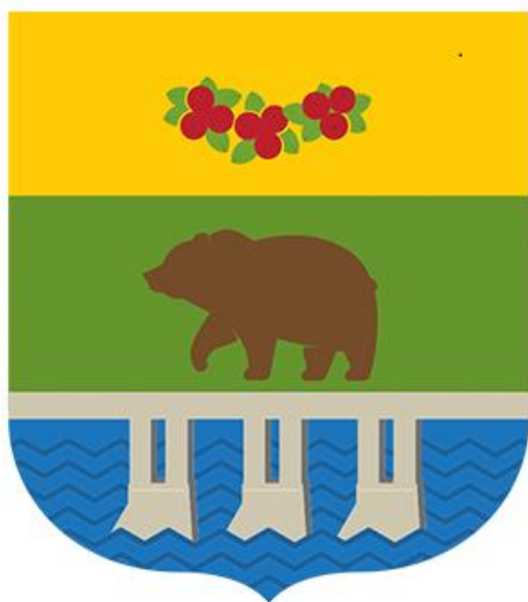
Схема теплоснабжения Ягодинского городского округа до 2028 года